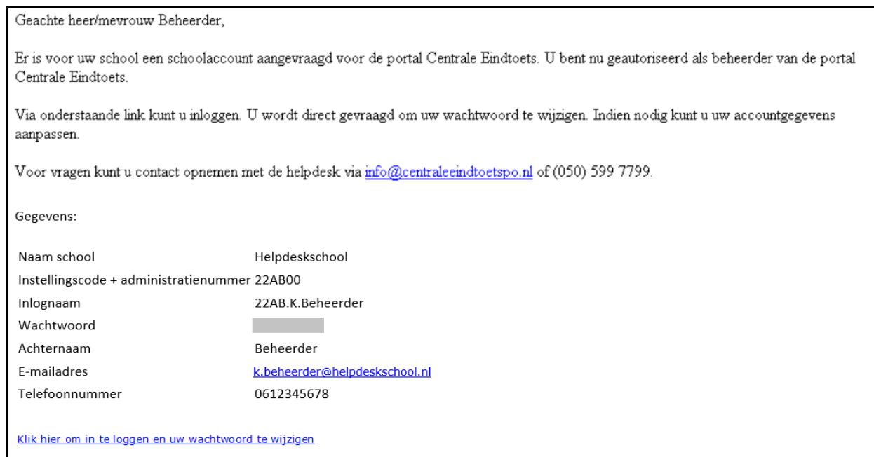
Afbeelding 2.9, Bevestigingsmail toewijzing account.

Binnen 5 werkdagen ontvangt de beheerder portal Centrale Eindtoets een e-mail (op het opgegeven adres) met een inlognaam en een wachtwoord.