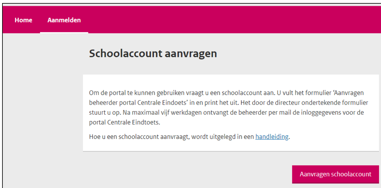
Afbeelding 2.1, Aanmeldscherm beheerder portal Centrale Eindtoets.

De portal Centrale Eindtoets is te bereiken via https://www.facet.onl/po/aanmelden