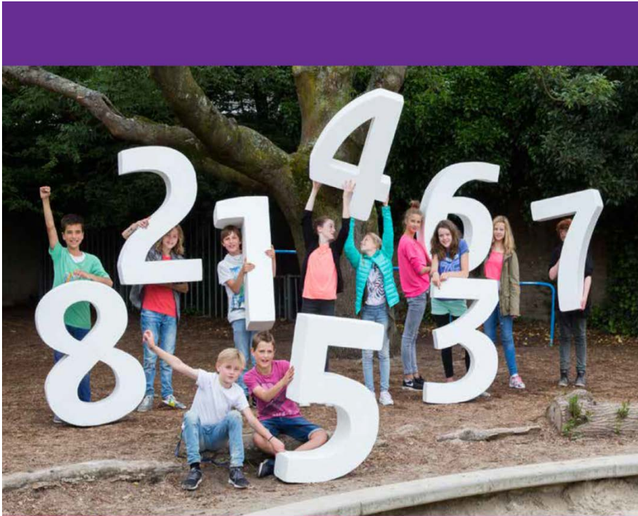
Centrale Eindtoets primair onderwijs