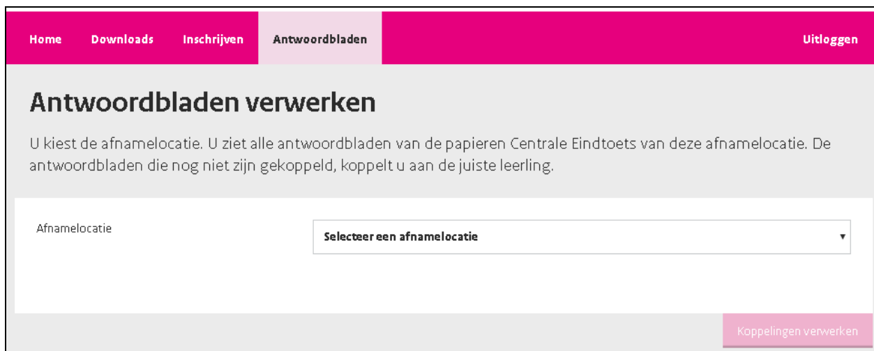
Afbeelding 2.2, antwoordbladen-afnamelocatie kiezen

De antwoordbladen van de papieren Centrale Eindtoets zijn in de meeste gevallen al gekoppeld aan de leerlingen die de toets hebben gemaakt. Klik op de optie 'Antwoordbladen verwerken'.